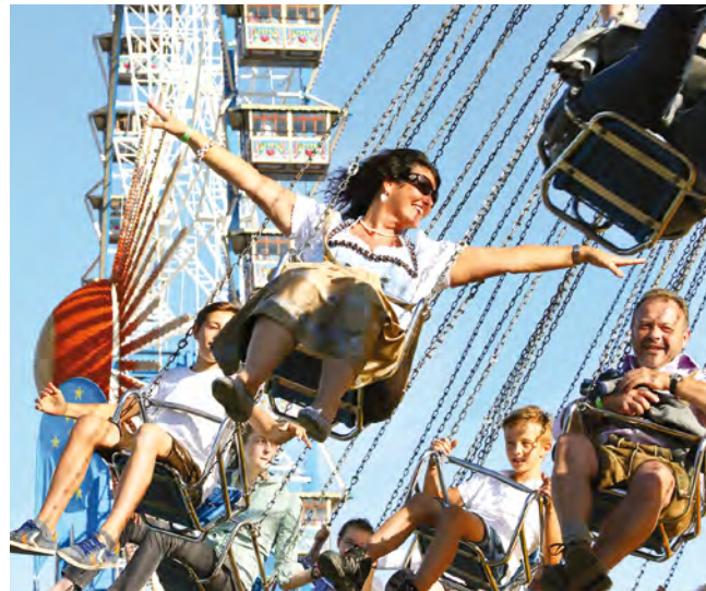
Auf der Wiese

München Tourismus E-Mail: tourismus.guides@muenchen.de Tel. +49 89 233-30234 oder -30204 Fax +49 89 233-30319 www.muenchen.de/guides